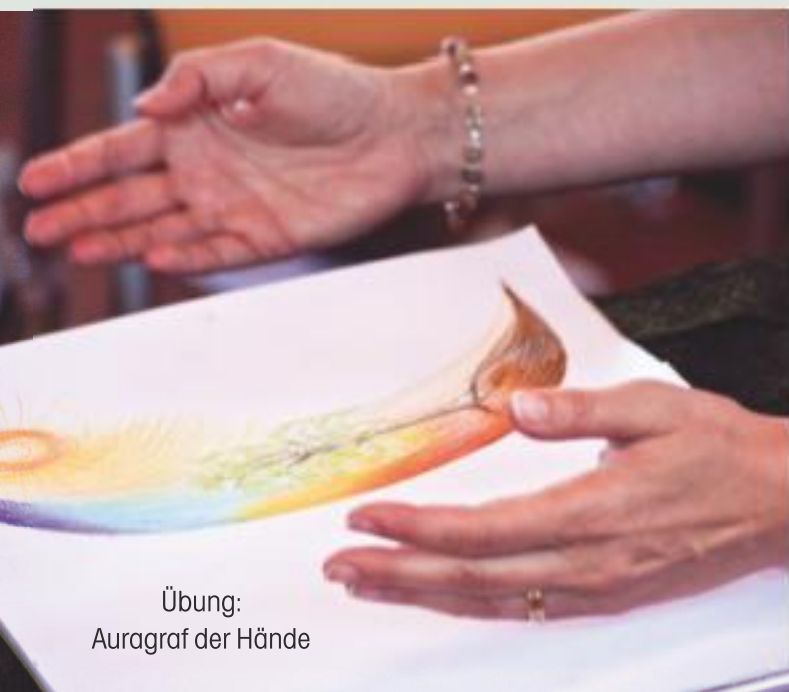
Übung: Auragraf der Hände

Darin liegt die Zukunft - im Privatleben wie im Beruf Sie können sogar ein neues Berufsbild wählen: "Medialer Lebensberater und Heiler" und dafür eine Prüfung ablegen.